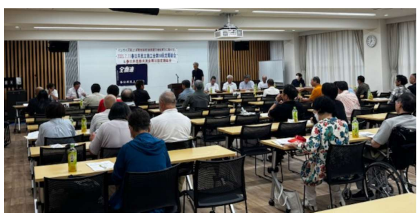
昨年の定期総会の様子

今年の総会も代議員制で開催します。会員は代議員でなくても誰でも参加し討議に加わることが出来ます。今から予定を空けて、多くの皆さんの参加をお願いします。お弁当を準備しますので参加いただける方は事前に支部役員か事務所までお知らせ下さい。