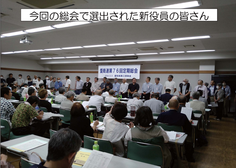
今回の総会で選出された新役員の皆さん

続いて午後からは、愛商連第76回定期総会が開催。こちらには180名が参加しました。会長あいさつ、来賓挨拶、方針案、決算予