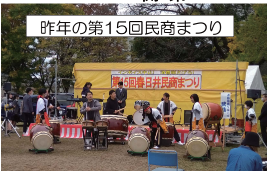
昨年の第15回民商まつり

毎年好評の小豆島ソーメン入荷しました 物価高でも値段据え置き 1.8キロ入り 2,500円