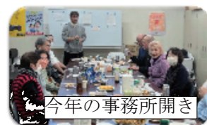
今年の事務所開き

毎年恒例の事務所開きは1月4日(木)に行います。 一品もちよりでどなたでも参加いただけます。 参加費はありません。