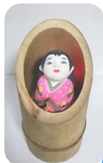
かぐや姫 ¥9,600 →¥4,800