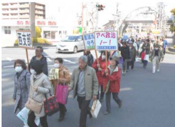
小牧税務署までみんなでデモ行進をした後、申告書を提出します

のんびりしているとすぐに提出期限です 3月になりました。皆さん、申告書は完成 させましたか?