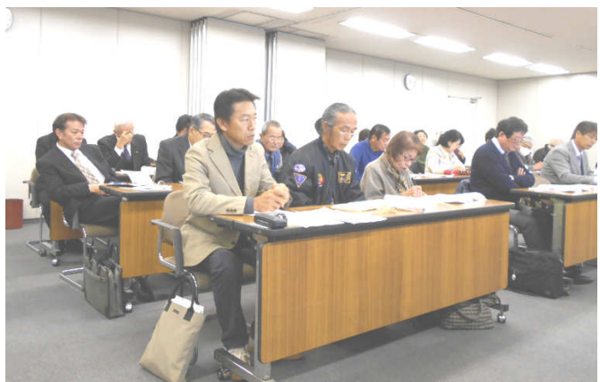
熱心に発言する参加者

春日井民商が毎年春日井市との間でやっている春日井市交渉が、11月24日(木)に開催されました。春日井民商からは会員21名が参加し、活発な討論がなされました。春日井市からは各課の課長・課長補佐12名が参加、日本共産党春日井市議団4名も参加しました。 冒頭で、マイナンバーを提供する意思がないのに、源泉徴収義務者へ「給与所得に係る特別徴収額の決定・変更通知書」にマイナンバーを通知されたらどう思うかについて問うたところ、「マイナンバーへの批判については個人的な意見はあるが…」などとはいうものの、「法律で決まったことなのでご協力をお願いしたい」「マイナンバーで個人の特定がされるようになる」と収納課としては助かる」といった意見がほとんどでした。 「給与所得に係る特別徴収額の決定・変更通知書」にマイナンバーを記載した