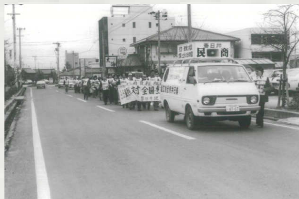
3・13 重税反対統一行動(1980年代)