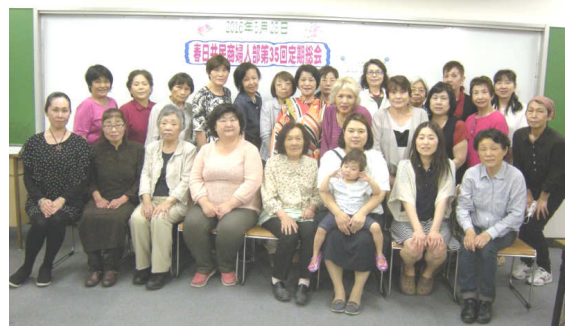
総会に参加された婦人部の皆さん

5月28日(土)、グリーンパレスにて第35回婦人部総会が開催され、28名が参加しました。 第1部の総会ではまとめと方針案、決算・予算案などを拍手で確認。第2部ではお弁当を食べながら楽しく懇談しました。