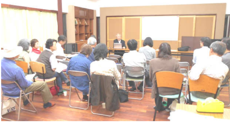
熱心に講演を聴く参加者たち