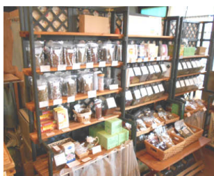
店内にはハーブの香りが広がっています