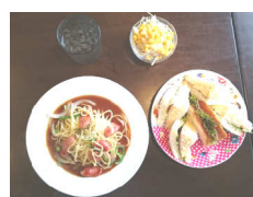
ハーフとは思えないボリュームのハーフ&ハーフ

春日井市役所近くの「セルピコ」では、朝はドリンク代のみでボリュームたっぷりのモーニング。ランチタイムは手作りでボリュームたっぷりの日替わりランチ(ドリンク付880円)が大好評。パスタ・サンドイッチ・ドリアからミニサイズを2種類選べるハーフ&ハーフ(ドリンク付930円)も人気です。野菜たっぷり、ボリュームたっぷり、愛情たっぷりの料理をあなたもぜひ！