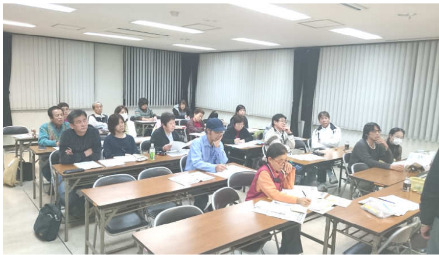
12月11日夜に開催された東支部のマイナンバー学習会には22名が参加し、関心の高さがうかがえました。

10月から見切り発車したマイナンバー制度。通知カードの配達では全国各地で混乱が生じていましたが、春日井市内ではほとんどの世帯に届いたようです。事務所でもマイナンバーに関する問い合わせが増えています。