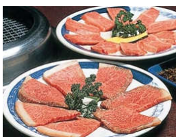
最高級の黒毛和牛を手頃な値段で...

感動の味は芸能人も足しげく通うほど。食材・栄養・健康にこだわる本物の焼肉・韓国料理をぜひお楽しみください。