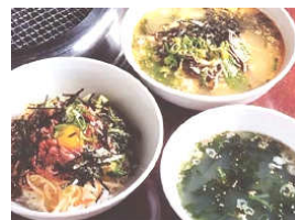
韓国料理メニューも充実しています