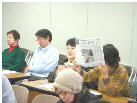
積極的に発言する参加者

冒頭でマイナンバーについて個人的な考えを聞いたところ、「制度については必要」という意見がほとんどでしたが、取扱いについては「慎重に」「大丈夫かという気持ちはある」といった意見が聞かれました。また、各種申請用紙へのマイナンバー記載については、「記載をお願いしたいが、記載する願わないか各人の自由意思だ」とのことでした。