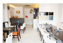
まるでカフェのよう なオシャレな店内