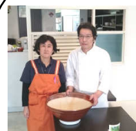
オーナーの 是松さん夫妻

従来の自然薯より粘り気の強い「夢とろろ」が味わえるのは春日井ではここ「みやび」だけです。