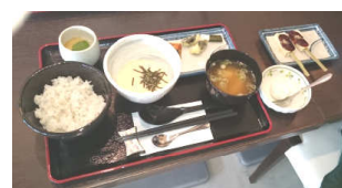
ご主人おすすめの 夢とろろランチ

ランチ中心の営業で、各種定食や、うどんやごはん、おかずが27通りの組み合わせで楽しめる「お昼限定セット(900円)」(限定15食)が人気。また、オーナーおすすめの「夢とろろランチ(1200円)」(限定8食)はデザートもとろろを使用し好評です。