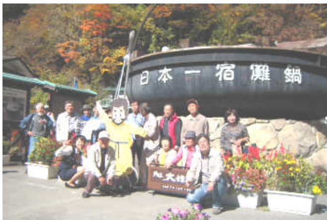
飛騨大鍾乳洞で記念撮影

また、大腸がん検診のキットも現在配布中ですので、支部の共済担当または事務所までお知らせください。