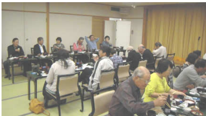
昼食は飛騨牛の朴葉みそ焼きでした