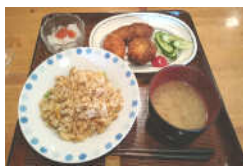
ある日の日替わりごはん