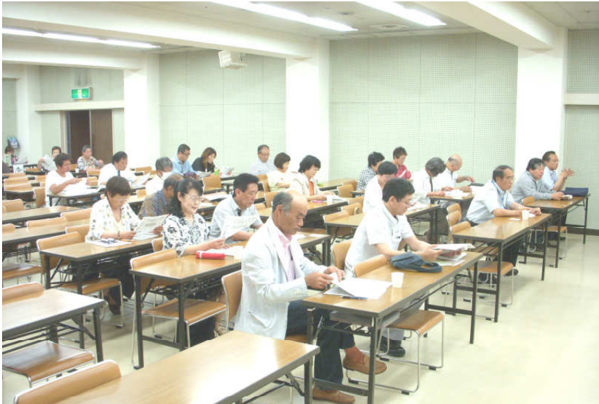
昨年の定期総会で、熱心に発言者の話を聴く参加者

グリーンパレス春日井1階第1会議室にて19時～(18時開場)です お弁当を出します