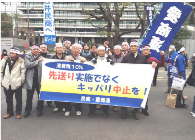
愛商連からは28名が参加し、元気よくデモ行進しました。

入って良かった 安心の全商連共済 共済加入者はインフルエンザ予防接種等の助成があります。詳しくは事務所までお問い合わせください。