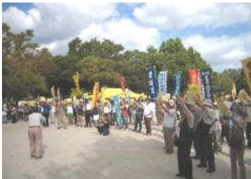
シュプレヒコールをあげる参加者

集会では小牧基地の機能強化を許さず、平和な社会づくりをめざすアピールが採択され、その後小牧基地までデモ行進を行いました。