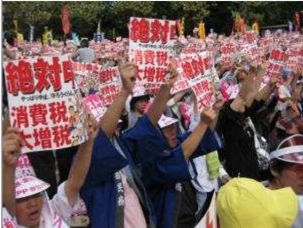
消費税増税を中止せよ！とこぶしを挙げる国民集会参加者

春日井民主商工会発行 春日井市ことぶき町183番地 電話 0568-81-1482 FAX 0568-81-9756 http://www.kasugaiminsoy.stl.jp