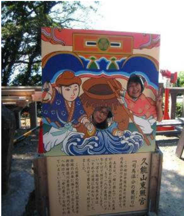
久能山東照宮にて

春日井民主商工会発行 春日井市ことぶき町183番地 電話 0568-81-1482 FAX 0568-81-9756 http://www.kasugaiminsyo.stl.jp