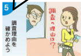
どんな理由で何の調査に来たのか理由を確かめること。「調査理由を明示すること」 巻末13頁～31頁 第72回定例会議要録(1974年6月3日)

今後、新たな調査の可能性もあります。税務調査10の心得にもとづいて冷静に対応しよう